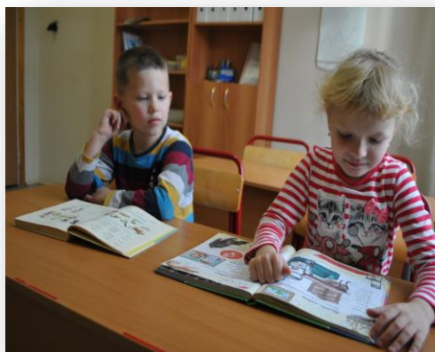
АООП НОО слабослышащих обучающихся Индивидуальный учебный план