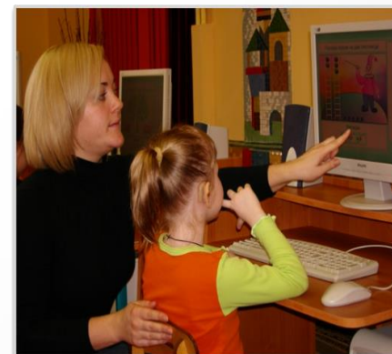
Специальные приемы обучения