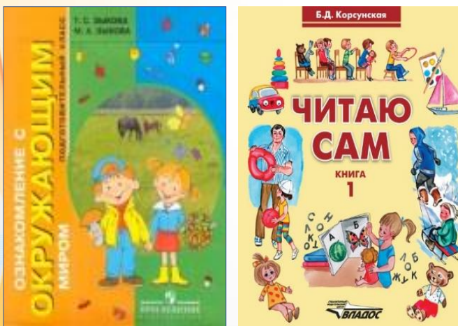
Специальные учебники и пособия