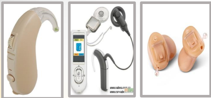
Индивидуальная звукоусиливающая аппаратура