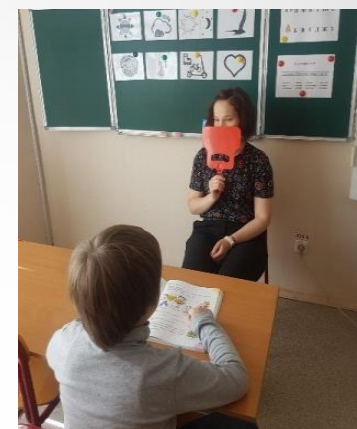
Коррекционно-развивающие занятия и комплексное сопровождение