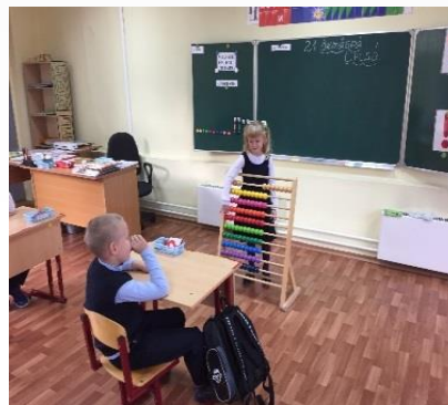
Специальная организация пространственной и временной среды