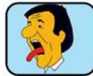
Сухость во рту