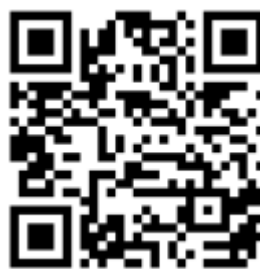
Рисунок 6 — Рекомендации по проведению кинопоказов в профилактике

Среди фильмов по тематике противодействия терроризму можно использовать следующие фильмы: «Беслан. Память» (Россия, 2014 г., возрастное ограничение: 12+), «Кавказский пленник» (Россия, 1996 г., возрастное ограничение: 18+), «Я не террорист» (Узбекистан, 2021 г., возрастное ограничение: 18+), «Отель Мумбаи: противостояние» (США, Австралия, 2018 г., возрастное ограничение: 18+) и т.д.