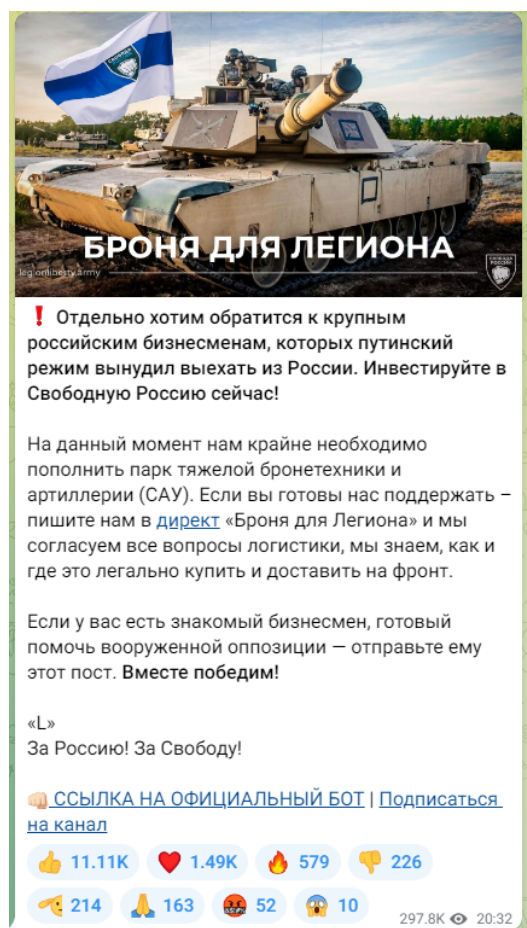
Рисунок 3 — Скриншот телеграм-канала легиона «Свобода России» с призывом к финансированию

Важно подчеркнуть, что помимо собственно пропаганды и распространения идеологии террористических организаций, а также вовлечения в деятельность террористических организаций существует еще одна угроза террористического характера — ложные сообщения о готовящемся террористическом акте. Только за 2021 год зафиксировано более 4,5 тысяч ложных сообщений о готовящихся терактах на объектах социальной инфраструктуры. Это может быть хулиганство, злой умысел, специфическое чувство юмора, желание проверить качество работы правоохранительных органов или антитеррористическую защищенность объекта и др. Во всех вышеперечисленных случаях за такой поступок придется нести уголовную ответственность. Ведь злоумышленник нарушает конструктивную деятельность общественных объектов, а правоохранителям приходится задействовать множество средств и сил, чтобы проверить объекты, которые якобы находятся под угрозой. За ложное сообщение о готовящемся теракте правонарушитель может быть наказан либо штрафами – от 200 тысяч рублей и до двух миллионов рублей, либо лишением свободы – от одного года до 10 лет. Ответственность за данный вид правонарушения наступает с 14 лет (статья 207 УК РФ «Заведомо ложное сообщение о акте терроризма»).