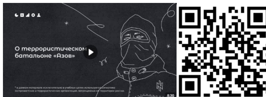
Рисунок 2 – Видеоролик, разъясняющий причины признания организации террористической

3) батальон «Азов» (см. рисунок 2) — военизированное подразделение, созданное в 2014 году на базе футбольных ультрас и праворадикалов Харькова и некоторых других украинских регионов. «Азовцы» причастны к массовым военным преступлениям против мирного населения Донбасса и Украины. Сама организация признана террористической в России по решению Верховного Суда Российской Федерации от 02.08.2022 г. № АКПИ22-411С. Батальон «Азов» входит в состав Национальной гвардии, подчиненной Министерству внутренних дел Украины. С 2014 года боевики батальона «Азов» систематически пытали, убивали и грабили мирных жителей ДНР, ЛНР и востока Украины. У батальона неонацистская идеология. Это проявляется в расизме, русофобии, восхвалении наследия Третьего рейха и украинских коллаборационистов в годы Второй мировой войны. Среди боевиков в том числе распространены радикальные неоязыческие взгляды. Свою идеологию боевики активно распространяют среди украинской молодежи через лагеря подготовки, печатную продукцию (комиксы, книги) и интернет-сообщества. С «Азовом» активно сотрудничает большое количество праворадикальных течений на Украине (признанных в России экстремистскими организациями), например, «Правый сектор», «УНА-УНСО», организация «Тризуб им. Степана Бандеры» и т.д.