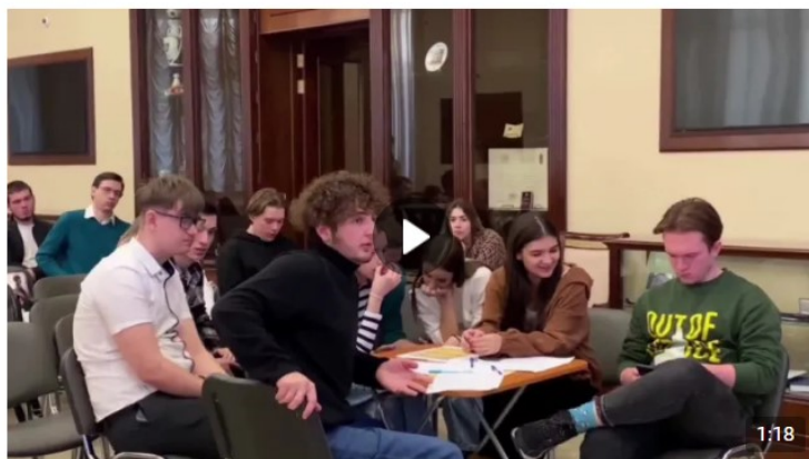
Дебаты «Идеология радикальных организаций» 1 888 просмотров

В рамках дебатов можно: развенчивать мифы, декларируемые представителями радикальных идеологий для вербовки; развивать навыки критического мышления и ведения дискуссии; формировать в целом антитеррористическое сознание и активную гражданскую позицию. Рекомендуется для мероприятия вовлекать не более 20 человек (см. рисунок 5).