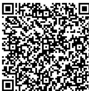
Рисунок 7 — Сценарий тематической викторины с примерами вопросов

В каждом из перечисленных мероприятий важно отслеживать активность участников, высказываемыми ими мнения, их настрой в целом. На таких мероприятиях необходимо присутствие психолога для фиксации активности и оценки их поведения.