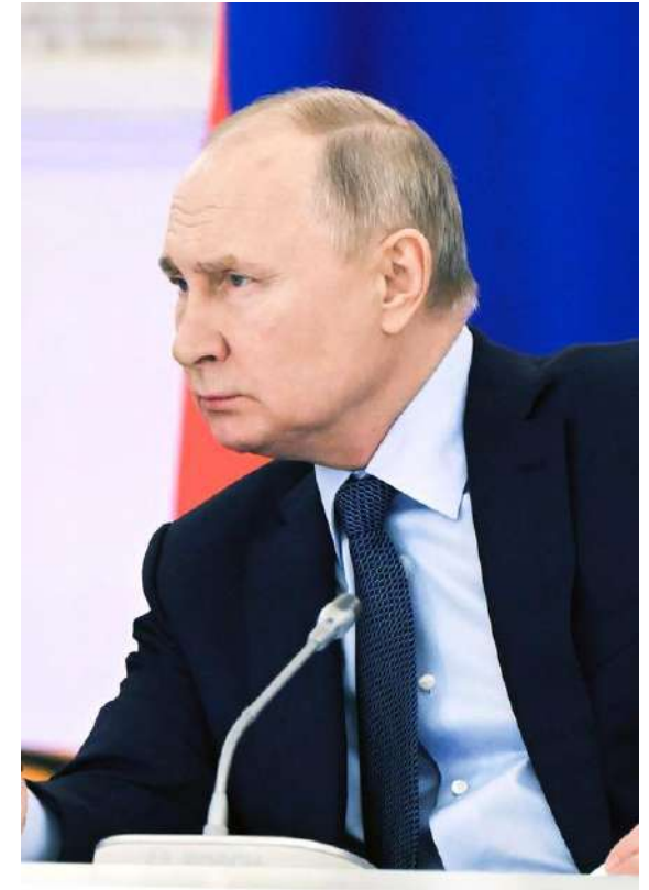
Владимир Путин на заседании Государственного Совета по вопросу «О повышении роли и престижа педагога и наставника» 27 декабря 2023 года